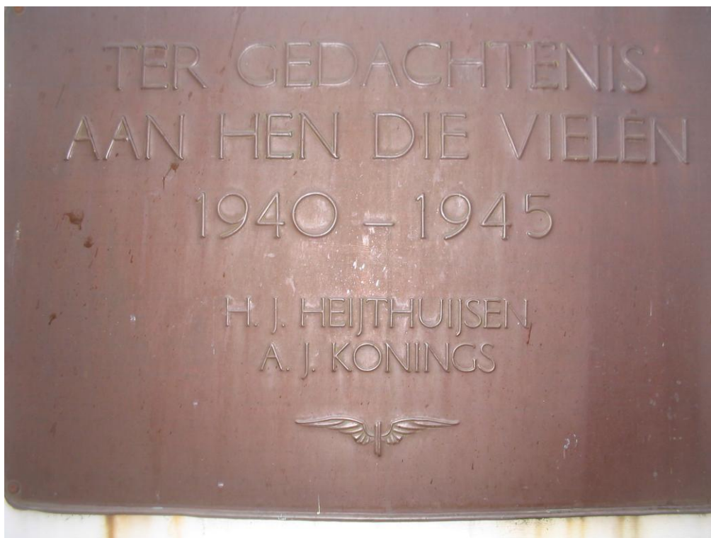
Dit gedenkteken is aangebracht bij het station te Echt. Bert werkte bij het spoor.